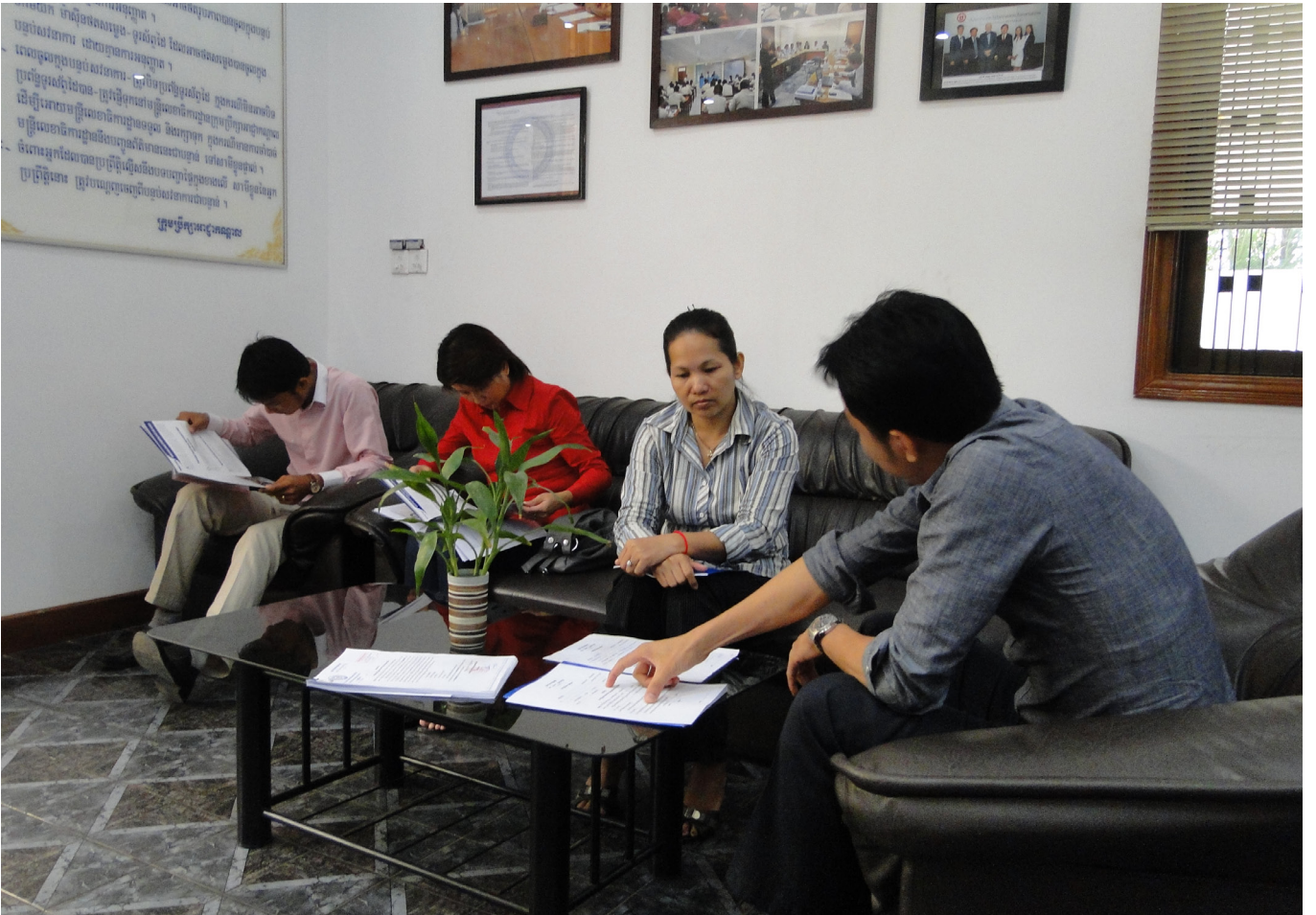
មន្ត្រីលេខាធិការដ្ឋានពន្យល់ភាគី អំពីដំណើរការរបស់ក្រុមប្រឹក្សាអាជ្ញាកណ្តាល

អ្នកត្រូវបានជ្រើសរើសដើម្បីទទួលនូវអ៊ីម៉ែលនេះពីមូលនិធិក្រុមប្រឹក្សាអាជ្ញាកណ្តាល ដើម្បីឈប់ទទួលព្រឹត្តិប័ត្រអេឡិចត្រូនិចនេះ សូមអ៊ីម៉ែលទៅ dvandeth@arbitrationcouncil.org ជាមួយប្រធានបទ “Unsubscribe – The AC E-Newsletter”.