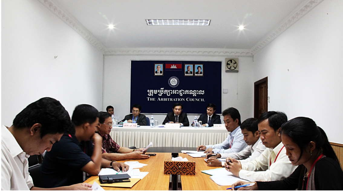
សវនករនៅក្រុមប្រឹក្សាអាជ្ញាកណ្តាល

-ជាទូទៅ ភាគីនិយោជក និងសហជីពមិនបានរៀបចំឱ្យបានល្អសំរាប់សំណុំរឿងរបស់ពួកគេទេ។ ឧទាហរណ៍ ពួកគេបាន ខ្វះខាតនូវឯកសារសំខាន់ៗ និងភស្តុតាង បើធ្វើការស្រាវជ្រាវរបស់ខ្លួន។